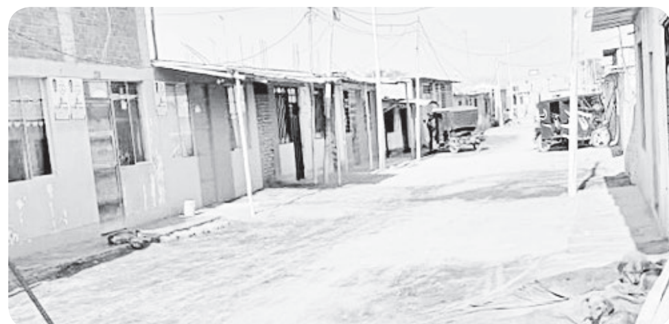
En la unidad vecinal Manuel Gonzales Prada de Ferreñafe, el estudiante fue atacado y perdió uno de sus dedos.